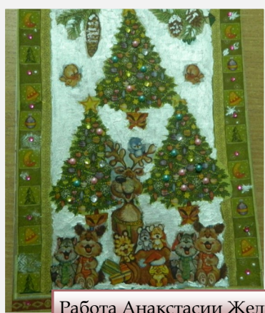
Работа Анастасии Желватых